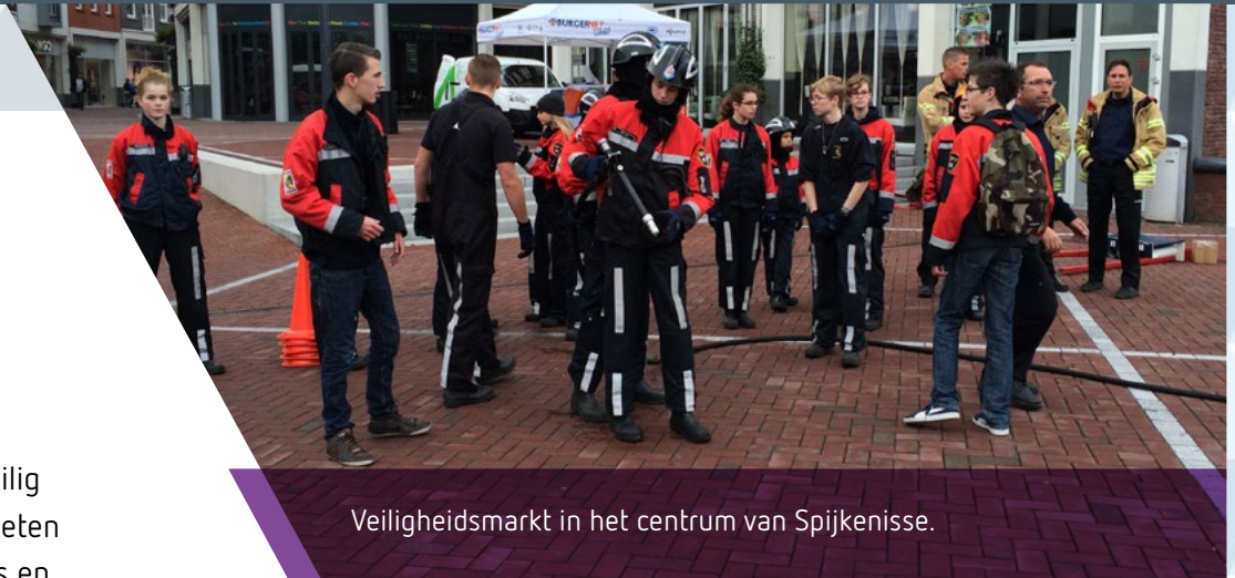
Veiligheidsmarkt in het centrum van Spijkenisse.

We vinden het onacceptabel dat onze inwoners in hun omgeving onveilig zijn of zich onveilig voelen. De aanpak hiervan begint bij het precies weten wat er speelt in de wijken en kernen. Dit doen we door actief inwoners en partners bij hun eigen omgeving te betrekken. We gaan met hen in gesprek en luisteren goed naar wat hen bezighoudt als het gaat om hun eigen veiligheid en die van hun naasten. We zoeken samen naar oplossingen en zullen daarin als gemeente ook flexibel zijn waar dat kan. We willen graag dat inwoners elkaar en de mensen die actief in hun buurt zijn, zoals de wijkagent, weer beter leren kennen. Zo voelen ze zich meer verbonden met hun wijk, kern of buurt. We werken zoveel mogelijk gebiedsgericht. Dat wil zeggen: we kijken wat waar het meest nodig is en aan de hand daarvan bepalen we de focus van onze inzet.