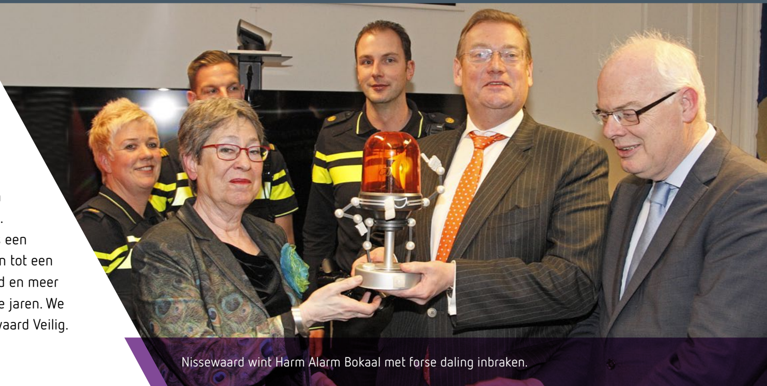
Nissewaard wint Harm Alarm Bokaal met forse daling inbraken.

De opdracht was om bij het nieuwe veiligheidsbeleid uit te gaan van deze veranderende samenleving en de nieuwe rol van de gemeente verder uit te werken. Dit hebben we gedaan en juist als een voordeel ervaren. We zijn gekomen tot een breder gedragen, meer inspirerend en meer integraal beleid dan in voorgaande jaren. We noemen het nieuwe beleid Nissewaard Veilig.