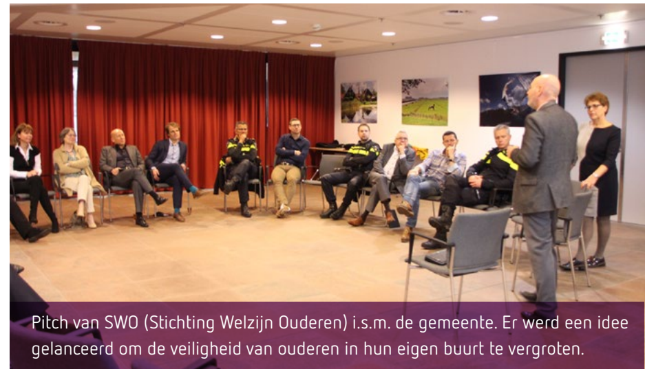
Pitch van SWO (Stichting Welzijn Ouderen) i.s.m. de gemeente. Er werd een idee gelanceerd om de veiligheid van ouderen in hun eigen buurt te vergroten.

In dit veiligheidsbeleid ook aandacht aan een bredere groep kwetsbare personen. Te denken valt aan onze oudere inwoners, aan mensen met een geestelijke of lichamelijke beperking of mensen die economisch in een zwakke positie verkeren. De focus van onze aanpak ligt daar waar mogelijk op preventie. Zware specialistische zorg zetten we in waar dat echt nodig is. Dit doen we door dichtbij de inwoners te zijn in de wijken en kernen. Zo signaleren we problemen eerder en pakken we ze integraal in één plan op. We luisteren bij het vinden van oplossingen veel meer naar familieleden en