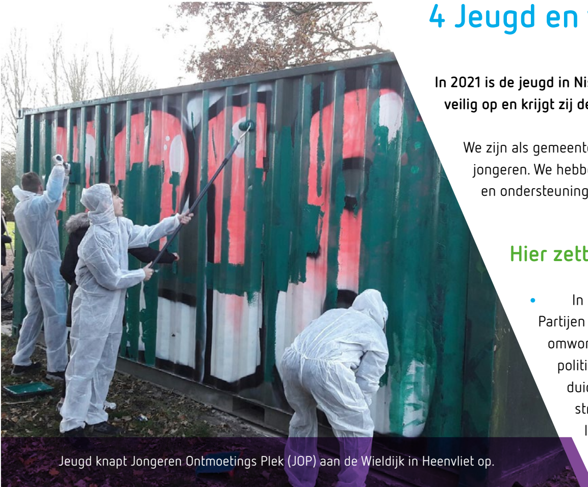
Jeugd knapt Jongeren Ontmoetings Plek (JOP) aan de Wioldijk in Heenvliet op.